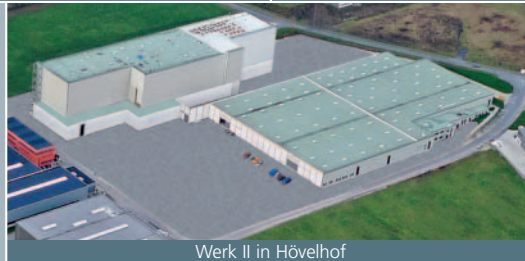
Werk II in Hövelhof

heroal hat den ausgeschäumten Rolladen erfunden und zählt seit über 40 Jahren zu den führenden Aluminium-Profilsystemherstellern, anfangs nur von Rolladen und Rolltoren, seit vielen Jahren jedoch auch in den Bereichen Fenster, Türen, Fassaden, Sonnen- und Insektenschutz sowie Photovoltaik.