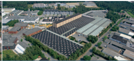
Werk I in Hövelhof