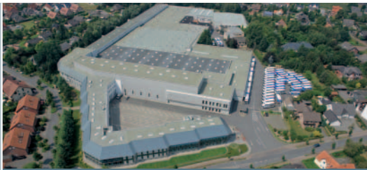
Werk in Verl